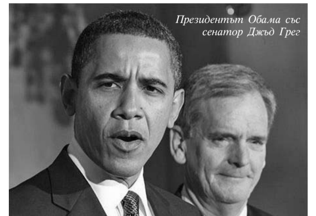
Президентът Обама със сенатор Джъд Грег

Джъд Грег, един от най-влиятелните американски сенатори, заяви, че антикризисната програма на президента Барак Обама, предвиждаща отпускането на 787 милиарда долара икономическа помощ за банките и компаниите, ще доведе САЩ до икономически крах, предаде РБК.