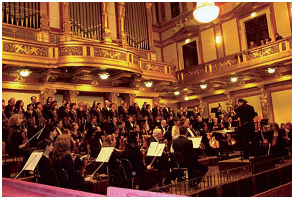
Инициативата се реализира с активното съдействие на посолството ни в Австрия.

В тържествената Златна зала на Музикферайн във Виена се състоя благотворителен гала-концерт, организиран в подкрепа на проекта за интегриране на ромското малцинство в Кюстендил. Събитието бе организирано от българската и австрийската организации на АДРА (Световна адвентна благотворителна организация за развитие и помощ). Тази високо хуманна инициатива се реализира и с подкрепата на българското Министерство на културата, Дирекцията по вероизповеданията към Министерския съвет и с активното съдействие на посолството на Република България в Република Австрия.